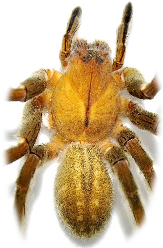
Abb./Fig. 1: Phoneutria boliviensis (F.O. Pickard-Cambridge, 1897), ♀, Groß-Auheim (Import), Habitus.

1 ♀, Deutschland, Hessen, Ginkgoring 70, 63533 Mainhausen-Mainflingen, Lebensmitteldiscount, 50°1'28,89"N, 9°1'3,98"E, 111 m ü. NN, TK25 (Messtischblatt) 5920, in Bananenkisten aus Brasilien, Lisa Kremer leg. 18.07.2009 (subadultes ♀; Reifehäutung: 28.8.2009), Handfang, P. Jäger det., A. Brescovit vid., coll. Senckenberg Forschungsinstitut, SMF.